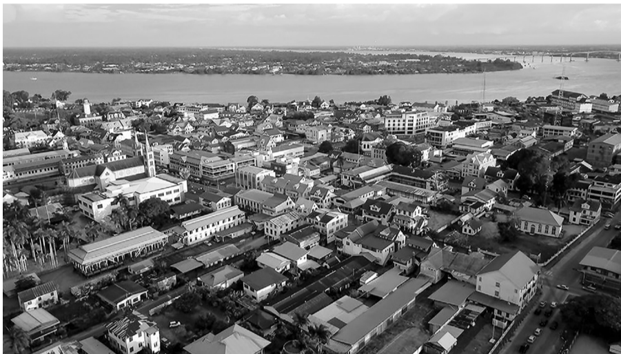
Paramaribo nhìn từ trên cao.

Suriname nhỏ về quy mô lẫn dân số nhưng lại không hề “nghèo” về vật chất hay văn hóa. Hãy nhìn vào nền ẩm thực của họ. Ở Paramaribo, du khách dễ dàng tìm thấy những nhà hàng Trung Quốc, Ấn Độ, Indonesia... nằm kề nhau. Mỗi món ăn của họ được pha trộn bởi nhiều nguyên liệu