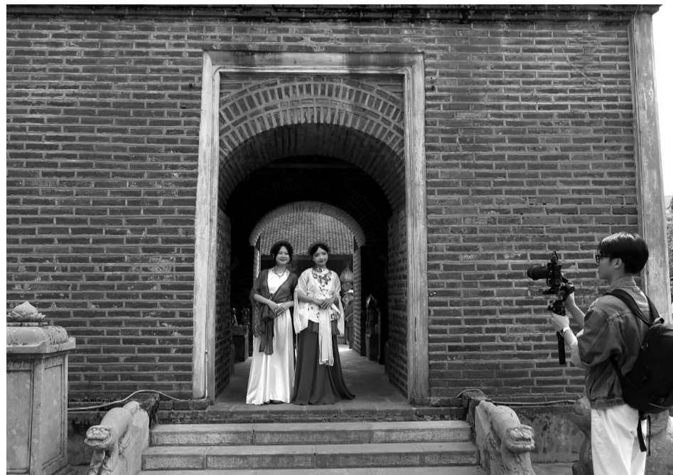
Các bạn trẻ mặc trang phục truyền thống quay clip tại chùa Dâu - một trong những di tích xuất hiện trong MV "Bắc Blink".