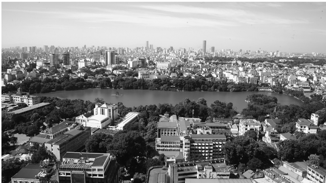
Hồ Gươm nhìn từ trên cao.

Thời Lê Trung hưng, con đê mới hình thành tương ứng từ Hàng Đậu qua Nguyễn Hữu Huân, Lý Thái Tổ đến đầu phố Trần Hưng Đạo nên hồ Lục Thủy nằm trong đê. Chúa Trịnh Giang cho xây phủ ở phía tây nam hồ Lục Thủy (tương ứng khu vực đầu phố Quang Trung) lại đắp con đường từ phủ sang phía đông hồ nên hồ Lục Thủy bị chia thành hai. Phía trên gọi là Tả Vọng (sau là hồ Gươm). Phía dưới gọi là Hữu Vọng (tên khác là hồ Thủy Quân). Chúa Trịnh Giang cũng cho xây cung Khánh Thụy trên đảo Ngọc (nay là đền Ngọc Sơn), lại cho xây Tả Vọng đình thấp nhỏ trên gò Rùa (nay là vị trí tháp Rùa) làm nơi giải trí, câu cá và tiệc tùng.