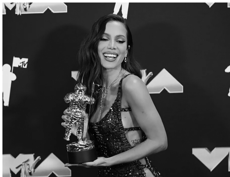
Nghệ sĩ trẻ người Brazil Anitta nằm trong danh sách 50 nhạc sĩ được trao nhiều giải thưởng nhất thế giới mọi thời đại với dòng nhạc Baile Funk.

Bốn thập kỷ sau khi ra đời từ những khu ổ chuột ở Rio de Janeiro, nhạc điện tử Baile Funk (hay còn gọi là Funk Carioca) đã có bước phát triển dài và trải qua nhiều biến đổi để trở thành hiện tượng âm nhạc toàn cầu. Baile Funk được coi như biểu tượng của sự đổi mới trong âm nhạc Brazil, đưa âm nhạc nước này chinh phục thế giới.