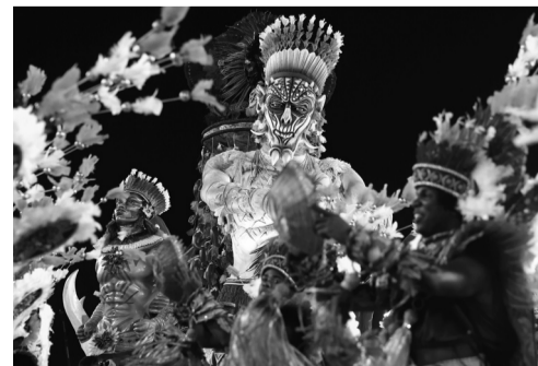
Người dân Suriname nhảy múa và rước kiệu nhân dịp lễ carnival.