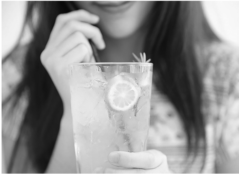
Nước chanh rất tốt nhưng nếu uống không đúng cách hoặc uống quá nhiều sẽ gây hại cho sức khỏe.