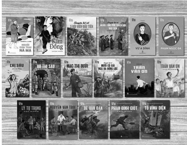
Một số tác phẩm về các anh hùng trẻ tuổi của NXB Kim Đồng.

săn thú, giúp mẹ làm nương, theo các anh lớn đi canh gác, làm thông tin liên lạc cho các anh chị du kích trong bản; để biết một Bé Văn Đàn mồ côi mẹ từ thuở bé, phải đi ở cho địa chủ từ lúc tuổi còn nhỏ và đã dũng cảm lấy thân mình làm giá súng để đồng đội bắn quân thù trong một trận chiến ác liệt; để lặng đi trước hình ảnh chị Sáu can trường, trước họng súng của quân thù vẫn bình thản cất cao tiếng hát; hay đây tự hào và khâm phục khi “nghe” câu nói bất hủ của anh Lý Tự Trọng trước kẻ thù: “Tôi chưa đến tuổi thành niên, nhưng tôi đủ trí khôn để hiểu rằng con đường của thanh niên chỉ là con đường cách mạng, không thể có con đường nào khác. Tôi tin rằng nếu các ông suy nghĩ kỹ thì các ông cũng thấy cần phải giải phóng dân tộc, giải phóng những người cần lao như tôi”.