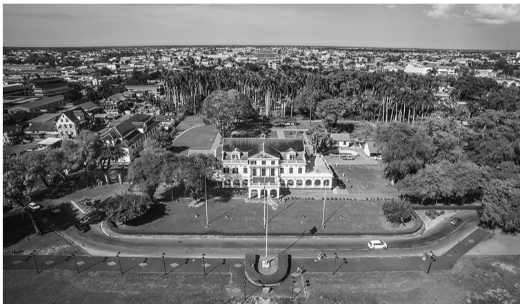
Dinh tổng thống Suriname và khu vườn cau.

cùng phương thức chế biến từ các nền ẩm thực khác nhau. Đơn cử như món pomtajer vốn được người Hà Lan chế biến từ khoai tây, nhưng khi sang Suriname lại được làm từ củ khoai mùng và thịt gà xé. Hoặc món cơm trộn moksi alesi thực chất là phiên bản “cải biên” của món nasi goreng nổi tiếng ở Đông Nam Á, bao gồm cơm nấu cùng nước dừa, đậu đen, tôm khô và thịt lợn trông thật đơn giản mà ngon đến khó cưỡng.