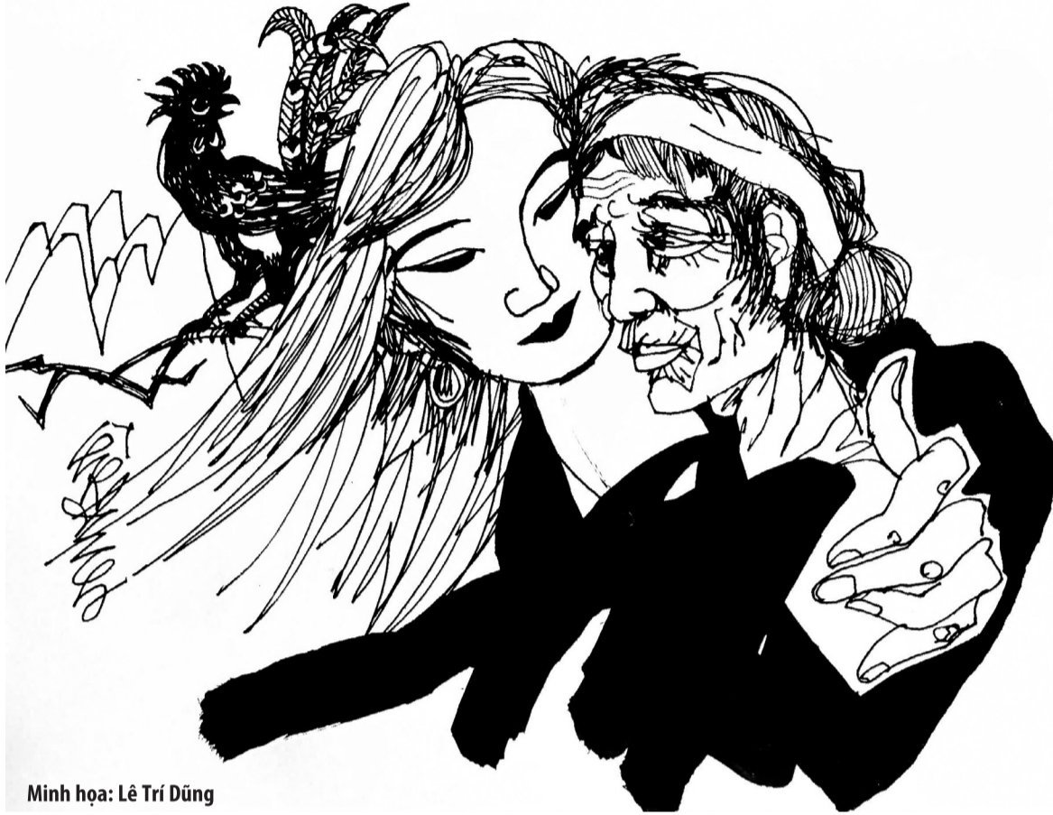
Minh họa: Lê Trí Dũng

Nắng chói chang xuyên qua kẽ lá tạo nên những vệt sáng lung linh trên mặt đất. An nhảy chân sáo trên con đường nhỏ hẹp giữa rừng cây rậm rạp, trên tay cô là một chú gà rừng với bộ lông rực rỡ. An nhìn chú gà vừa mới bắt được mà lòng hân hoan, vui sướng.