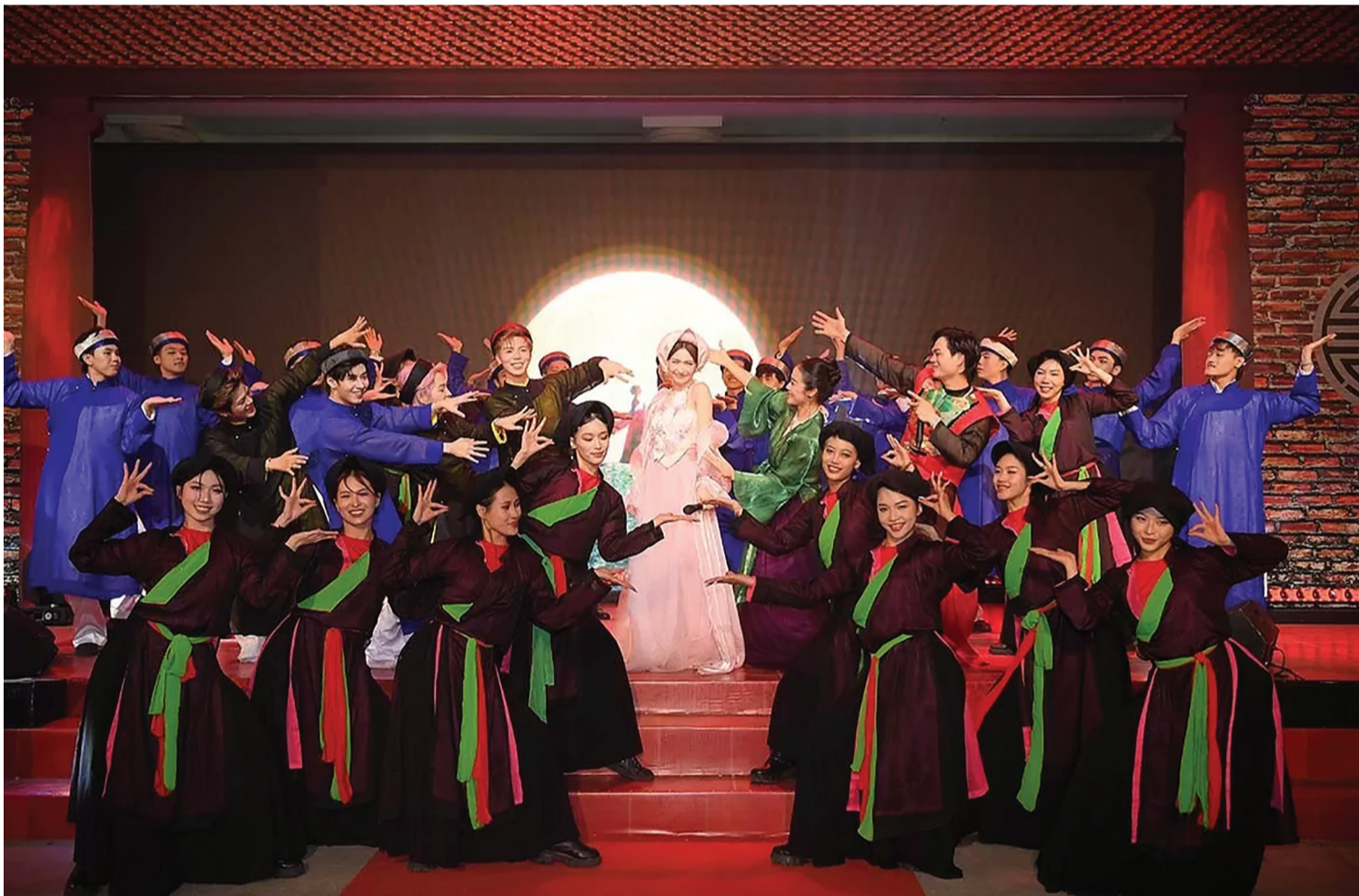
MV "Bắc Blink" của ca sĩ Hòa Minzy đã lọt Top 1 MV "Best Debut" (MV ra mắt ấn tượng nhất), Top 1 "Song Best Debut" (Ca khúc ra mắt ấn tượng nhất)... chỉ sau một vài ngày ra mắt.