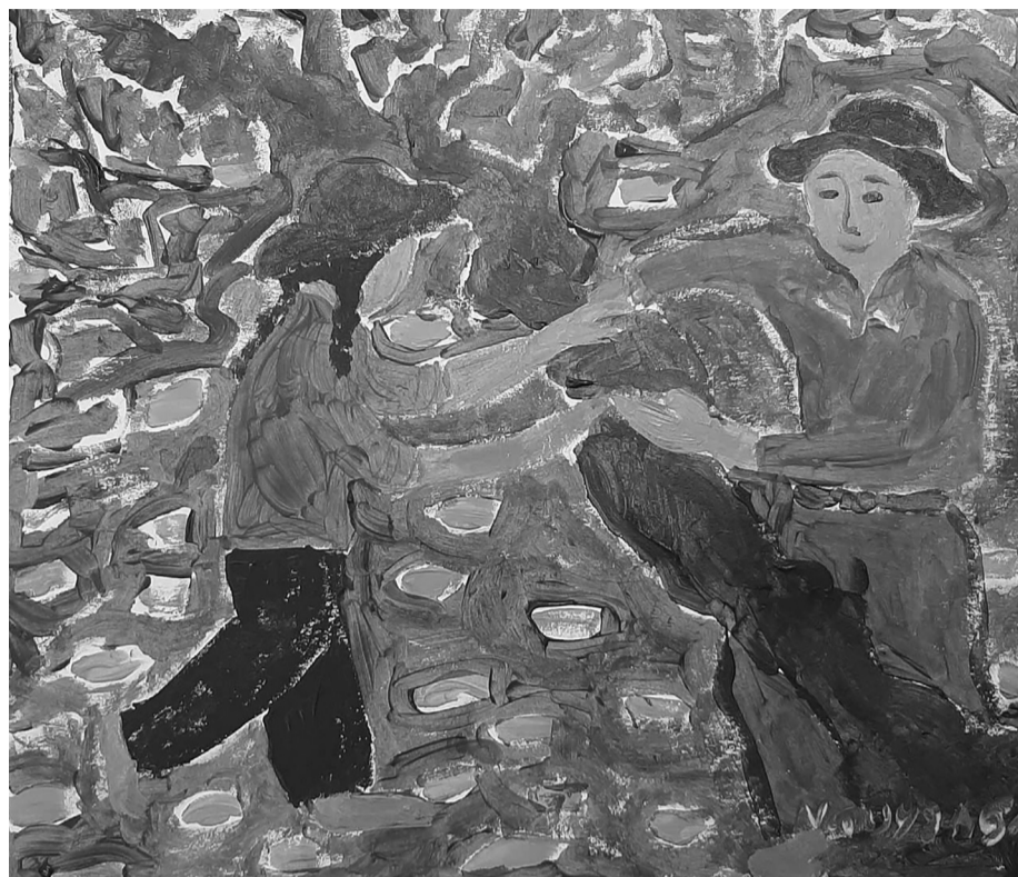
Minh họa: Nguyễn Sa

Tháng Ba về trên nẻo đường quê, cô gái áo xanh đắm mồi hôi tất bật với những hoạt động tháng “thanh niên tình nguyện”. Chẳng phải những thời gian trong năm nhàn hạ, mà công việc của thanh niên nơi này lúc nào cũng rộn ràng, nhất là những ngày tháng Ba, nào là kết nạp Đoàn viên, tổ chức chương trình về nguồn hay tiếp tục những chuyến thiện nguyện. Cô gái áo xanh đắm mình trong những hoạt động ấy, ngày nào cũng mồi hôi nhễ nhại, nhưng tâm hồn luôn phơi phới, tràn đầy niềm vui và tự hào khi được đóng góp sức trẻ của mình cho những dự án xanh của quê hương.